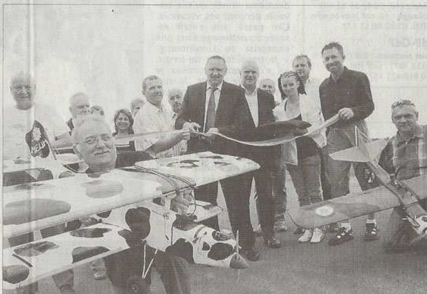
Deux ans que le Club d'aéromodélisme Yutz-Lorraine l'attendait cette nouvelle piste! Elle devrait permettre d'attirer de nouveaux adhérents.